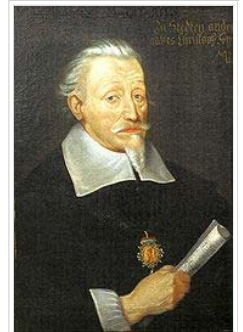
ハインリヒ・シュッツ